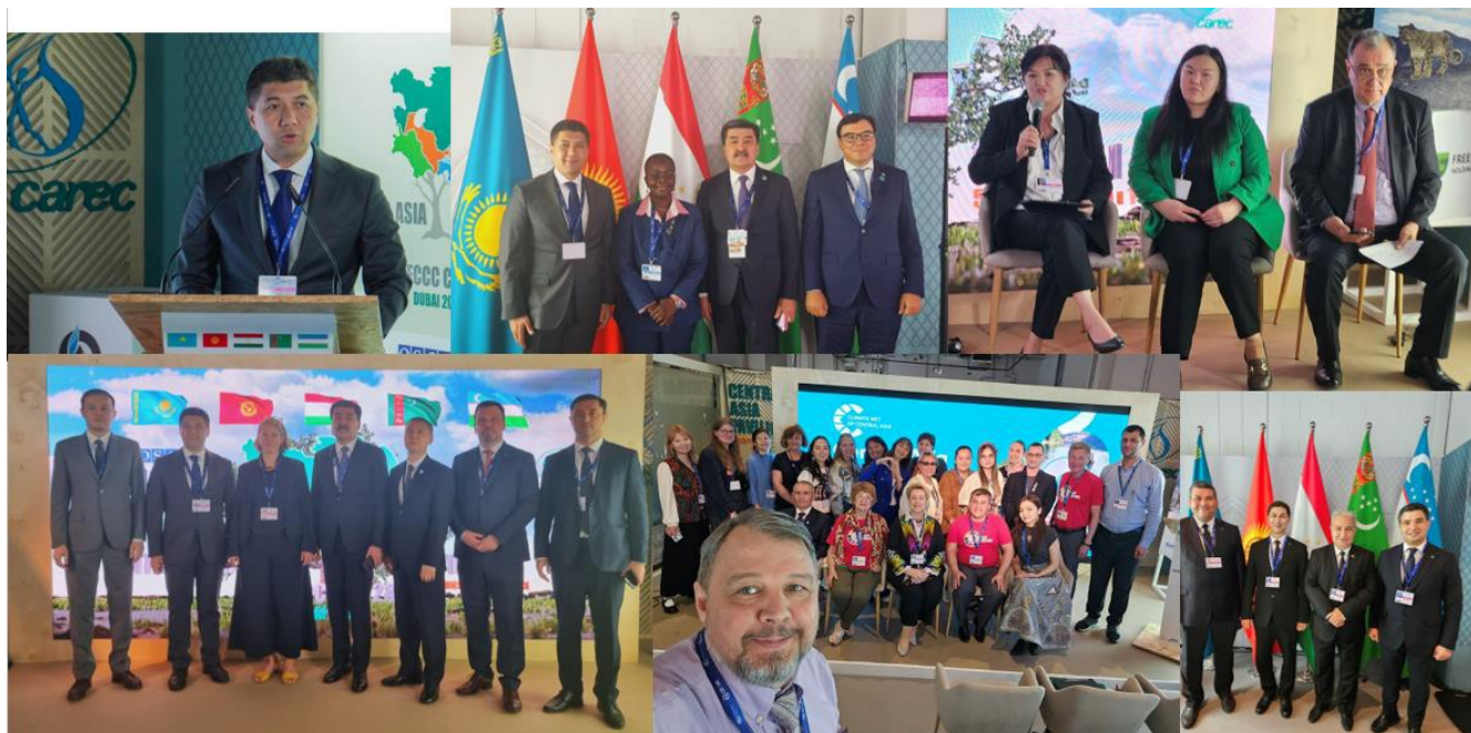
Рис. 1. Работа павильона стран Центральной Азии – РЭЦЦА

В этих достижениях немалая роль принадлежала Заявлению стран ЦА и Заявлению гражданского общества и молодежи ЦА. Их значимость гораздо выше, чем объявление об общем понимании проблем климата и приоритетов деятельности. Наличие двух заявлений